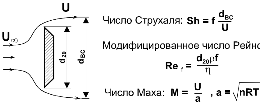
Рис.1 Подобие процессов вихреобразования в следе за обтекаемым телом.

4.1.3. Структура течения и закономерности формирования регулярных вихрей в широком диапазоне параметров и составов газа однозначно определяется тремя числами гидродинамического подобия (рис1).